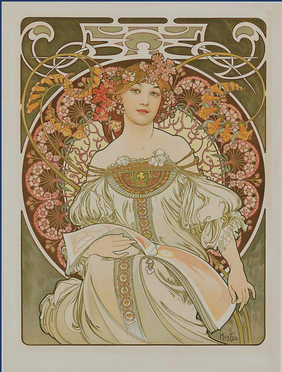
アルフォンス・ミュシャ 《夢想》 1898年 堺 アルフォンス・ミュシャ館蔵 (レプリカ)