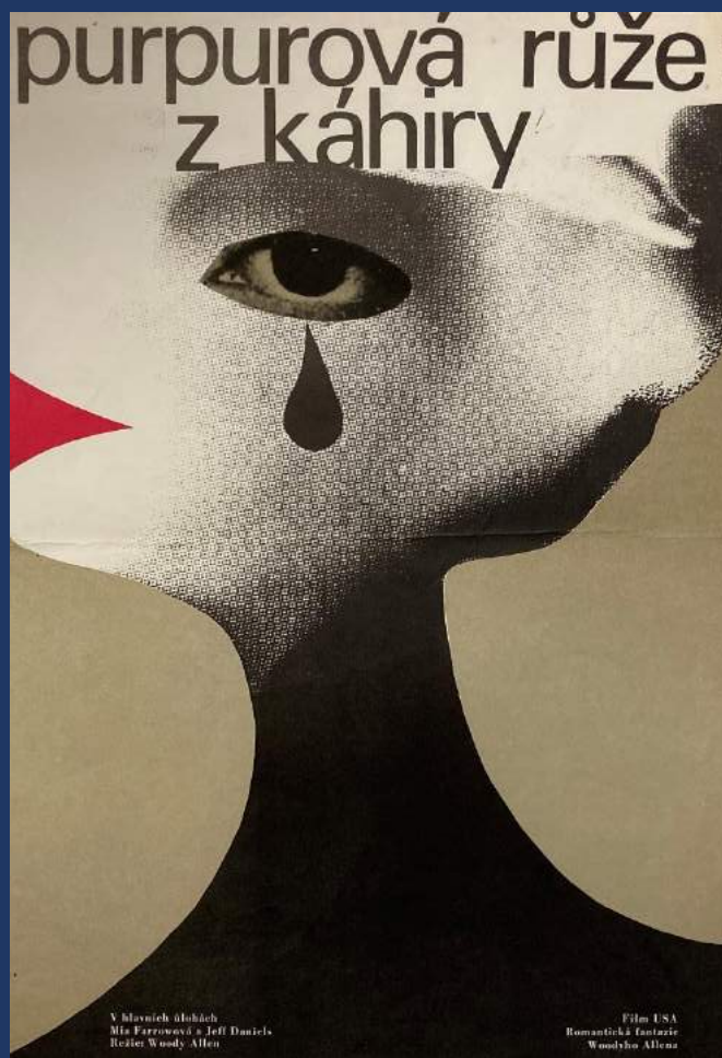
映画ポスター《カイロの紫のバラ》 1958年 南 明弘 南 晃代 コレクション