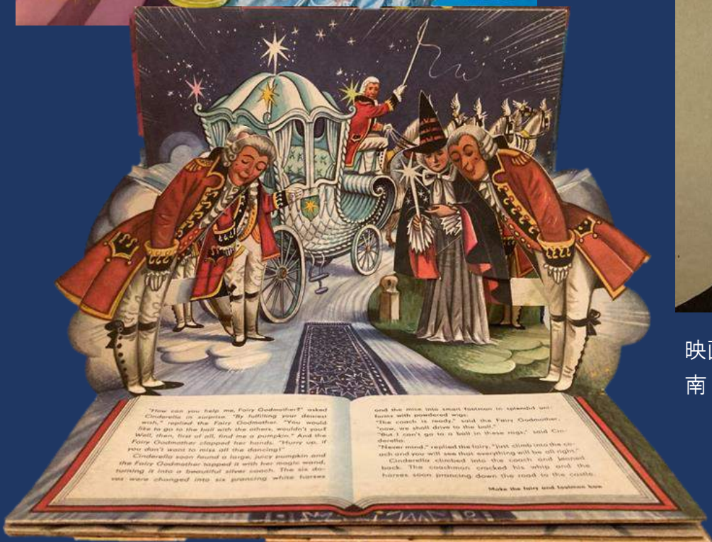
ヴォイチェフ・クバシュタ 仕掛け絵本 《シンデレラ》 1983年 南 明弘 南 晃代 コレクション